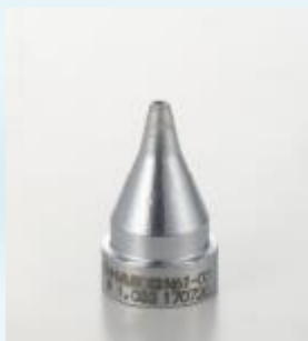
SS kialakítású fejek, kis forrasztószemekről történő kiforrasztáshoz

A Hakko FR301 készülék ugyanazokat az N61 sorozatú kiforrasztó csúcsokat, használja, mint a Hakko FR410 nagy teljesítményű asztali kiforrasztó állomás. Ez a gondosan megtervezett család számos formájú kialakításban, minden feladatra megfelelő megoldást kínál.