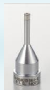
Hosszított fejkialakítás, amely megkönnyíti a hozzáférést a szűk helyekhez