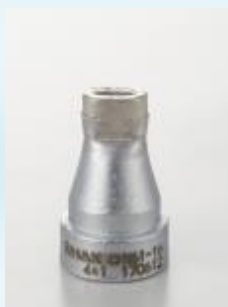
Ovális szívónyílású fejek, lapos érintkezőkapcsok kiforrasztásához