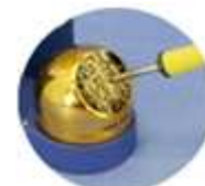
Tisztítás HAKKO 599B tisztítóval